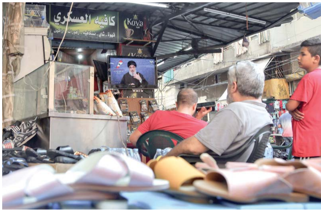
خطاب لا يرمم الدمار

أمين عام حزب الله يطالب بتحقيق سريع وحاسم وغير مسيس