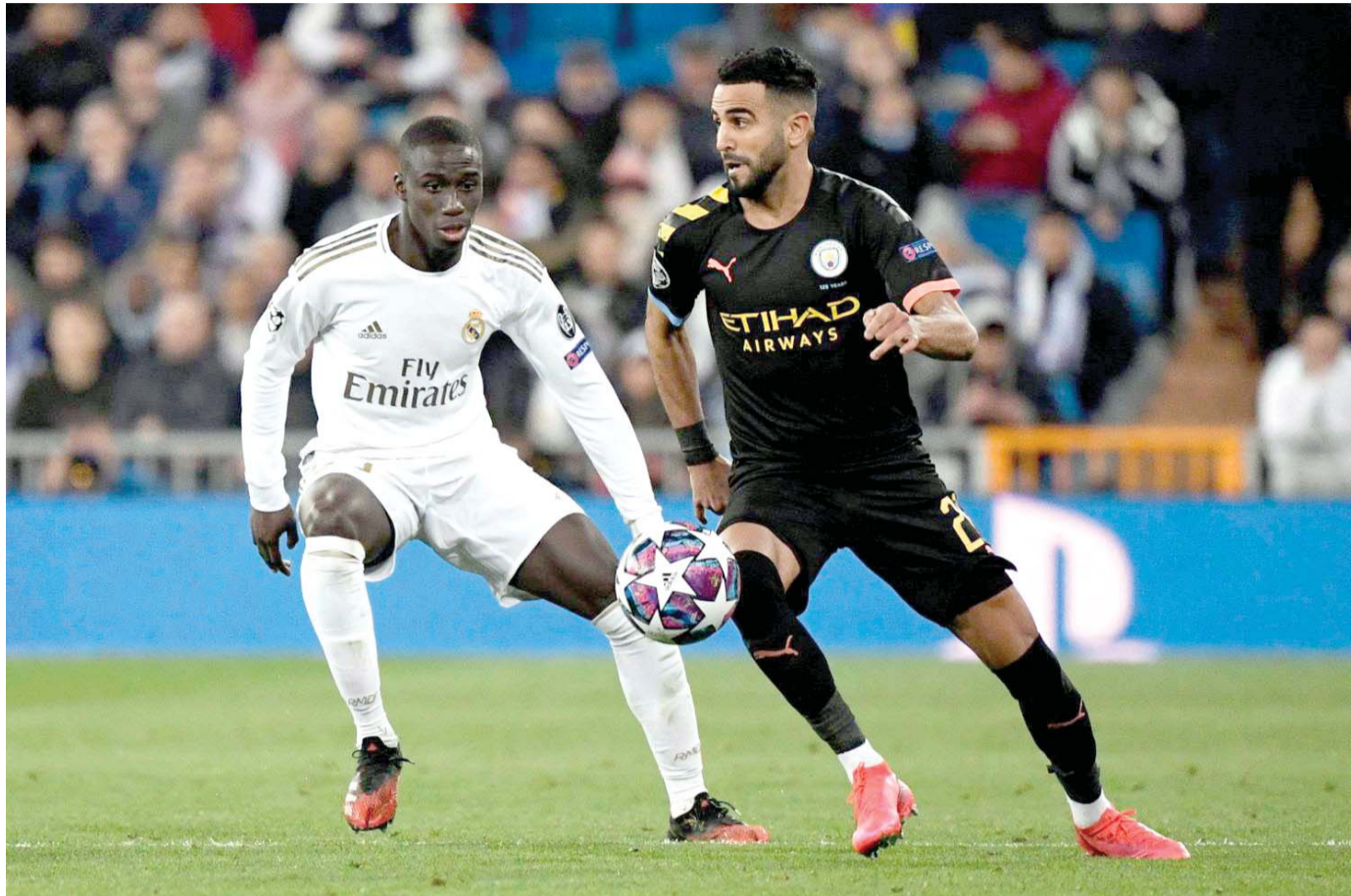
قمة واعدة بين غريمين

يوفنتوس يحلم بريمونتادا على أرضه أمام أولمبيك ليون