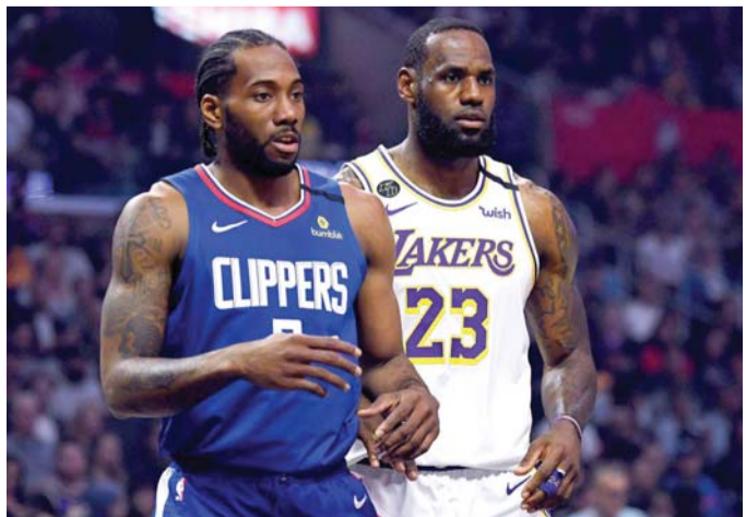
جاهزان بانتظار ضربة البداية

ويقع اللاعبون الذين يناهز عددهم الـ350، في ثلاثة فنادق موزعة في المجمع، مع تقييد حركة الدخول إلى كل فندق