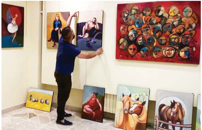
رصد لحالات متنوعة

وقدم الفنان في ذات التجربة معرضا سابقا بعنوان "أمي سأقول لك سرا" في غاليري مصطفى على ربيع هذا العام، واختزل المعرض بمشاهد التعبيرية ضمن تجربته الدائرية الثالثة قصة الحياة ومشاعر الأمومة والرابط الحميمي المقدس بين الأم والأبناء وصولا إلى مرحلة الجدة.