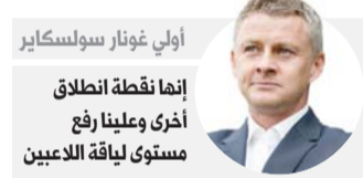
أولي غونار سولسكاير

ويرى هؤلاء المحللين أنه مهما كان مستوى أي فريق، خصوصاً الأندية