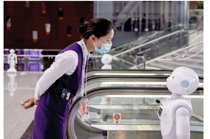
علم أكثر ذكاء يولد من رحم الأزمة