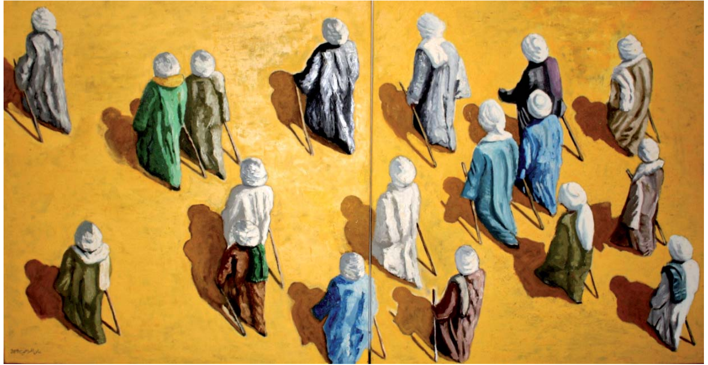
معالجات لونية متنوعة

لوحات ومنحوتات تقصف شهوانية الذكور وتلصصهم على عالم النساء