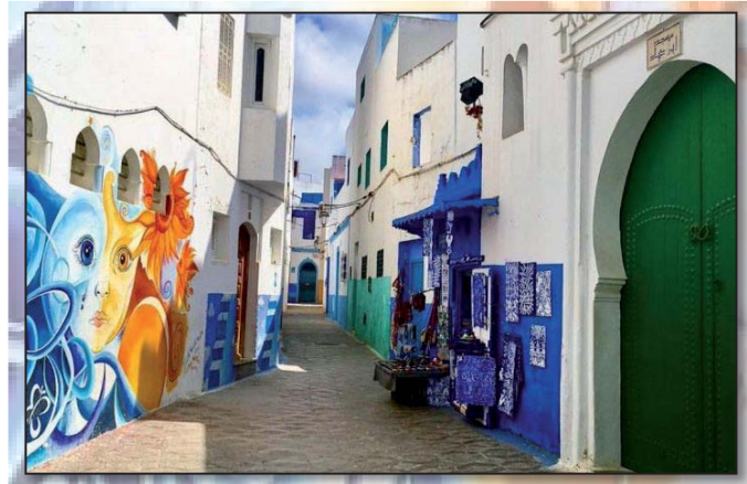
الفن يجمع الشعوب ويوحدها