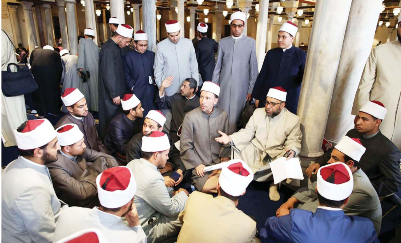
دفع لقصص أجنحة الأزهر

ما أفرز اختراقا في وعي المصريين بخطابات خارجية حملت أبعادا دينية من دون أن يواجهها أحد، وذهب الأزهر باتجاه التركيز على الهوامش وأغفل كثيرا أساسيات المواجهة. وأشار إلى أن الحكومة تمارس ضغوطا من اتجاهات مختلفة على شيخ الأزهر، أبرزها الحفاظ على وزير الأوقاف محمد مختار جمعة في منصبه لمدة ست سنوات تقريبا، كإحدى أدوات الضغط ونجاحه في سحب البساط من بعض الشيء من تحت أقدام شيخ الأزهر، وأن تقوية الإفتاء عبر أساليب قانونية تسير على هذا الطريق. ويتفق متابعون على أن أوراق الأزهر محدودة في مواجهة الحكومة بفعل التركيز على التحديات الإقليمية، وأن لجوء شيخه إلى عزلته في بلدته بإحدى قرى محافظة الأقصر (جنوب مصر) لن يأتي بنفاره هذه المرة، كما أن وقوفه في وجه تنظيم الإخوان لم يعد كافيا لأن يتسدى في جموده، لأن هناك مواجهات دولية للإخوان في ظل التصعيد التركي الجديد في ليبيا.