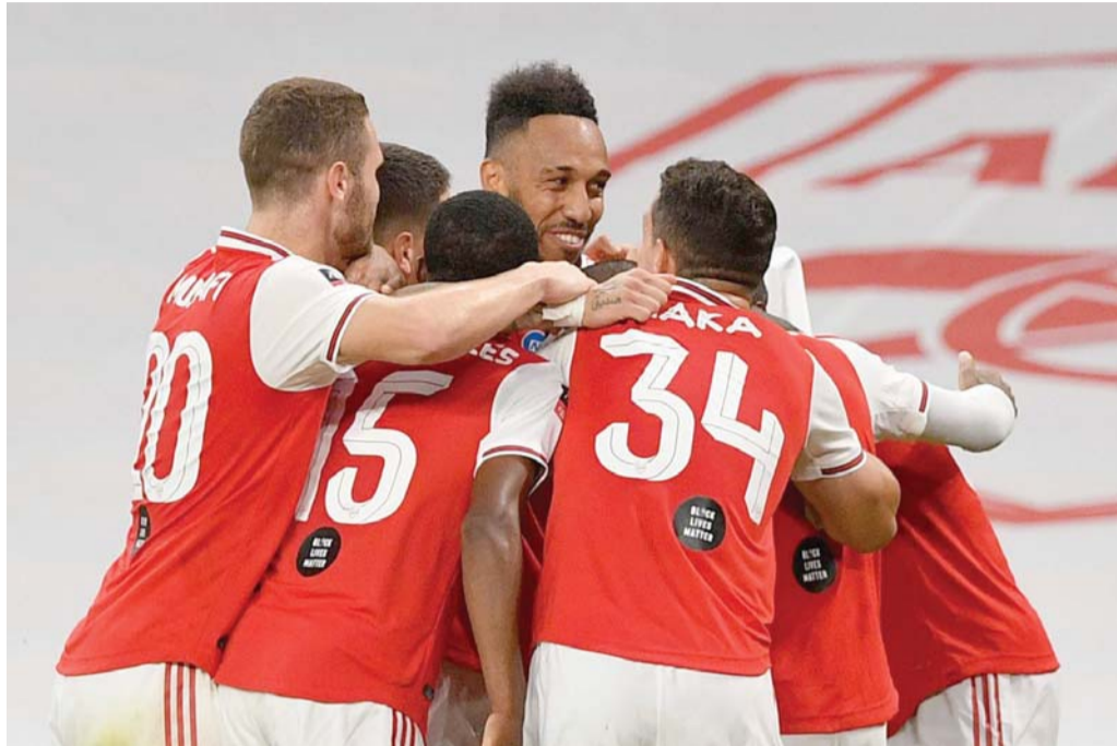
مجموعة يمكن التعويل عليها

أرتيتا يصحح أخطائه ويربك حسابات «معلمه» غوارديولا