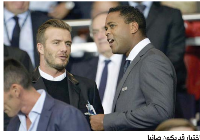
اختيار قد يكون صائباً