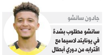
جادون سانشو سانشو مطلوب بشدة في يونايتد لاسيما مع اقترابه من دوري أبطال أوروبا

ورداً على سؤال رفض سبيتين تفسير انتقادات ميسي على أنها موجهة إليه بالذات. وقال «كلا، على الإطلاق. جميعنا نقول أشياء قد يتم تفسيرها بشكل خاطئ. الغضب الطبيعي في هذا النوع من اللحظات، لكنني لا أعيرها (الانتقادات) أهمية كبيرة». وأكد أنه التقى رئيس النادي جوسيب ماري بارتميو «من الطبيعي حصول اجتماعات كهذه. نريد جميعاً أن نحسن الأوضاع، ننجح عن حلول، وهذا هدف الاجتماع، تحضير المستقبل بتفاوض، مباراة الغد وما يتبقى من دوري الأبطال. محاولة تحمل كل منا مسؤوليته بعد عدم الفوز بلقب «الليغا هذا الموسم. وشدد على أن «الجميع يدرك وجود أمور يجب تحسيتها (...) لكن لا يمكنكم إقناعي بأن كل ما جرى كان كارثياً. هذا ليس صحيحاً. كنا نستحق الفوز بعدد أكبر من المباريات، وأعرف أنه لا يزال في إمكاننا إنقاذ العديد من الأمور»، مؤكداً أنه «في يوم رحيلي، سأغادر وأنا مرتاح البال».