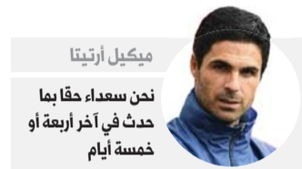
ميكيل أرتيتا نحن سعداء حقاً بما حدث في آخر أربعة أو خمسة أيام

وبعد شهر من خسارته بثلاثية نظيفة أمام سيتي في الدوري الإنجليزي الممتاز، رد أرسنال الدين بفوزه 2-0 على ملعب «ويمبلي» العريق، ليحرز مكاناً له في المباراة النهائية بانتظار ما ستسفر عنه الموقعة الثانية الأحد بين مانشستر يونايتد وتشيلسي.