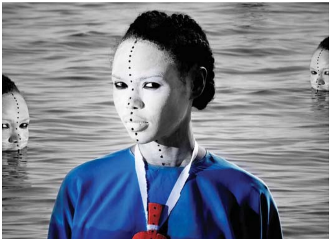
عوامل أفريقيا الخصبية

ويستعرض الجزء الثاني من المعرض، وهو من تقييم الفنانة عابدة مولوني، أعمالا لمصورين أفارقة معاصرين، سبق وأن تم عرضها في مهرجان أدبسون فوتو، الذي يعتبر المهرجان الدولي الأول والوحيد للتصوير الفوتوغرافي الذي أطلقتها مولوني في عام 2010 في شرق أفريقيا، ويقام كل عامين في أديس أبابا في إثيوبيا.