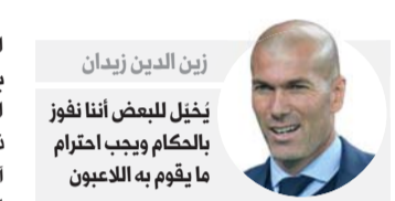
زين الدين زيدان يُخيل للبعض أننا نفوز بالحكام ويجب احترام ما يقوم به اللاعبون

ويغت محفلون رياضيون إلى أنه رغم تساؤل فرص برشلونة في حسم لقب الدوري هذا العام، إلا أنه من المفيد عودة الفريق إلى سكة الانتصارات ويؤكدون على أن ذلك يبقى مهماً بالنسبة إلى توازن النادي الذي يلف الغموض العديد من نجومه للبقاء معه.