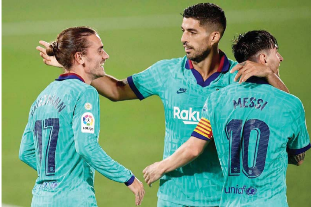
وضعية جيدة لإعادة البناء

الفريق الكتالوني يسعى للبقاء في دائرة المنافسة على لقب الليغا