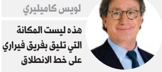
لويس كاميليري هذه ليست الماكينة التي تليق بفريق فيراري على خط الانطلاق

وقال لويس كاميليري الرئيس التنفيذي لفيراري "ندرك أن الكثير من العمل في انتظارنا. هذه بالتأكيد ليست الماكينة التي تليق بفريق فيراري على خط الانطلاق". وأضاف "علينا أن نرد بقوة، ينبغي علينا بكل وضوح التطور".