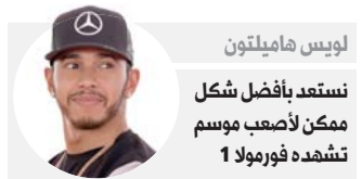
لويس هاميلتون نستعد بأفضل شكل ممكن لأصعب موسم تشهده فورمولا 1

فيينا - ينطلق موسم بطولة العالم فورمولا 1 للسيارات في النمسا الأسبوع المقبل بعد أربعة أشهر من الموعد المخطط لضربة البداية بسبب جائحة كورونا. وستقام المنافسات في أجواء مختلفة تماما رغم أن هدف لويس هاميلتون يبقى ثابتا دون تغيير. ويستطيع بطل العالم 6 مرات معادلة رقم مايكل شوماخر أسطورة فيراري في حصد سبع القابض بينما يتطلع مريديس إلى تحقيق رقم قياسي بالجمع بين لقبين السائقين والصانعين للمرة السابعة على التوالي. ويطمح السائق البريطاني، الذي استغل شعبيته لإطلاق حملة لتوفير المزيد من التنوع في الرياضة ومن أجل