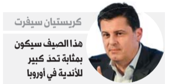
كريستيان سيفرث هذا الصيف سيكون بمثابة تحد كبير للأندية في أوروبا

برلين - فتح النجاح الملحوظ الذي عرفته مسابقة البوندسليغا خلال الموسم الكروي الاستثنائي هذا العام بسبب انتشار وباء كورونا، الباب أمام موجة تغيير منتظرة في كرة القدم الألمانية سيتناولها المسؤولون بالدراسة والنقاش هذا الصيف، وتأتي على رأسها قضية عودة الجماهير إلى المدرجات التي تحظى بأولوية مطلقة نظرا لتأثيراتها السلبية. وكشفت مصادر صحافية الثلاثاء، أنه رغم أن الدوري الألماني يعتبر نموذجا يحتذى باعتباره أول بطولة أوروبية تستأنف نشاطها، إلا أن ذلك لا يمنع من وجود تغييرات في الأسق وتبرز أهمها مسألة عودة المشجعين إلى المدرجات.