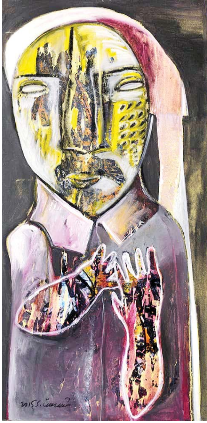
الفن الذي كان يغير العالم يفقد قدسيته