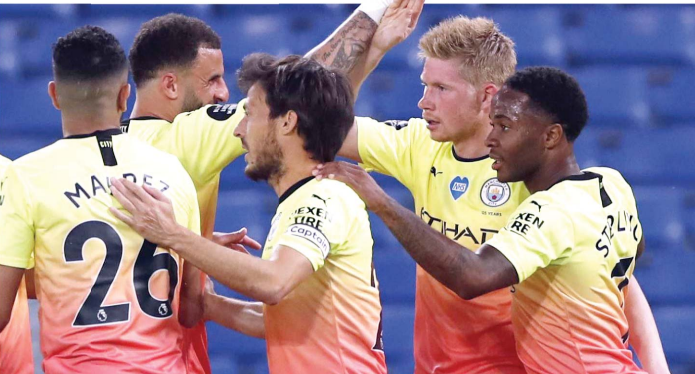
اليد في البحث عن التعويض

وحتى الآن لم تتم الصفقة ولكنها متقدمة للغاية، وربما تعلن بشكل رسمي في غضون أيام، أي بعدما لعب النجم المغربي آخر مبارياته بقميص دورتموند مساء أمس السبت، أمام هوفنهايم، وستكون المباراة الأخيرة له مع النادي الذي لعب له في آخر موسمين، وحاولوا استمراؤه سواء عن طريق شرائه أو إعارة جديدة، ولكن المنافسة القوية مع الفرق الأوروبية الأوربية عرقلت استكمال مسيرته داخل الفريق الألماني.