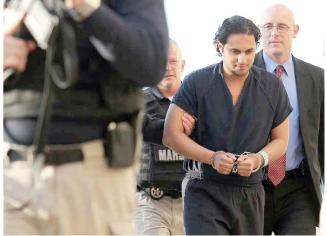
الدوسري بريء، وفق السعوديين

ترويج المنصة العالمية للقضايا العربية بـ«الطريقة التي تناسبها» يثير الجدل