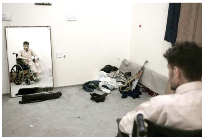
مقعد بسبب تعذيب الحوثي

وكتب المحامي في تغريدة أرفقها بوثيقة باللغتين العربية والإنجليزية