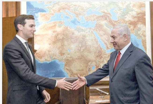
انحياز أميركي واضح لصالح إسرائيل

وكتب المرشح الجمهوري الجمعة على تويتر "لم تبدأ حملتي بعد. سنتطرق مساء السبت في أوكلاهوما".