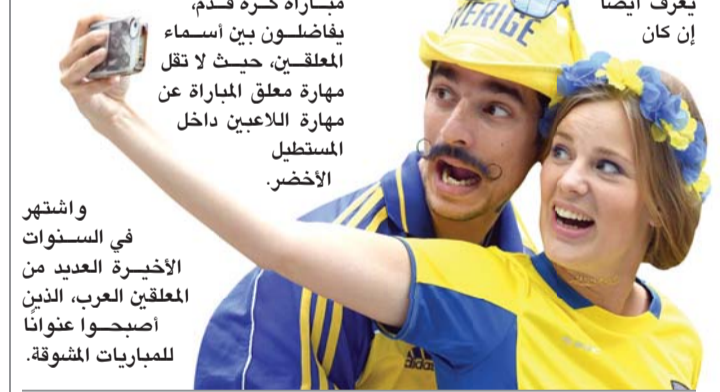
واشتهر في السنوات الأخيرة العديد من المعلقين العرب، الذين أصبحوا عنوانا للمباريات المشوقة.

# قلنا نيغا (نريد) فويس نوت (ملاحظات صوتية) في DM!