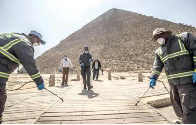
تعقيم كامل ومتواصل