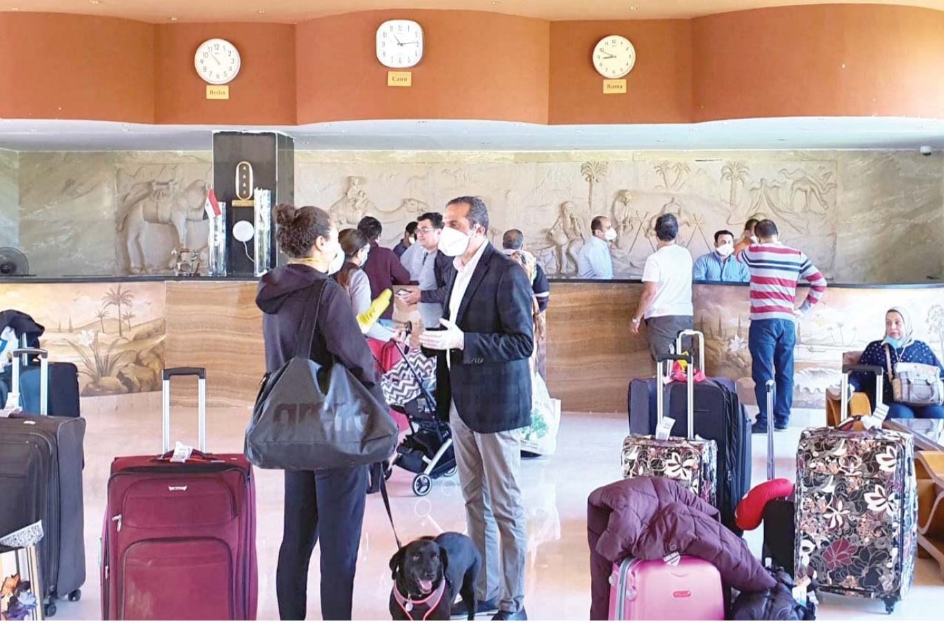
عجلة السياحة الداخلية تدور

منتجعات البحرين الأحمر والمتوسط تستأنف عملها للخروج من العزلة