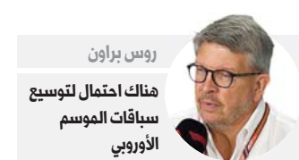
روس براون هناك احتمال لتوسيع سباقات الموسم الأوروبي

وقال منظمو سباق جائزة سنغافورة الكبرى إن "القيود المفروضة والتي تعيق وتمنع إنجاز حلبة السباق، أجبرتهم على اتخاذ قرار بإلغاء السباق الليلي". وبلغ عدد حالات الإصابة بكوفيد - 19 في سنغافورة نحو 39 ألف حالة وهو من أعلى المعدلات في قارة آسيا.