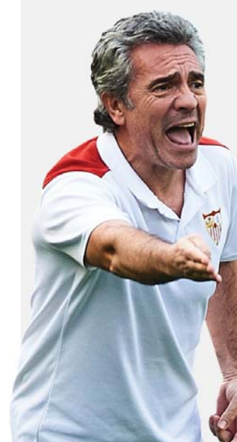
ليلو أشرف على غوارديولا حين كان الأخير لاعبا في صفوف فريق دورادوس المكسيكي في أواخر مسيرته الكروية

لكن الحاصل اختلف بشكل كبير هذا الموسم حيث سجل هدفا واحدا وصنع خمسة أهداف أخرى خلال 15 مباراة وهو ما يعد سجلا سيئا، رغم حقيقة معاناته من الإصابات.