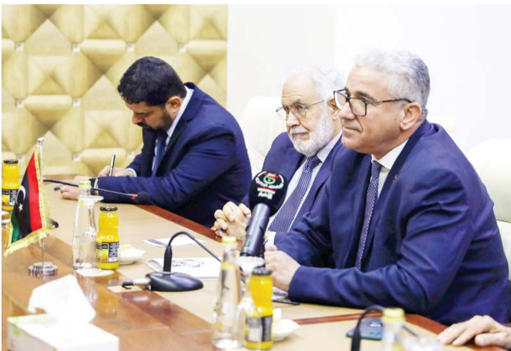
باشاغا وزير برتبة رئيس

والوفاء ونشطاء على مواقع التواصل الاجتماعي هجوما واسعا على معيتيق، بسبب طلبه من أمر غرفة "تحرير سرت الجفرة" وقف عمليات اقتحام سرت بناء على طلب الجانب الروسي الذي أكد له أن سرت خط أحمر.