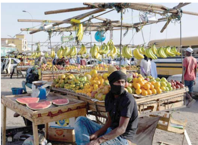
تدهور القدرة الشرائية

وأوضحت أن هذه البنى التحتية هي التي ستسمح ببناء اقتصاد قادر على حل المشاكل عبر إنتاج الثروة وتوفير فرص العمل والموارد المالية الضرورية لتأمين