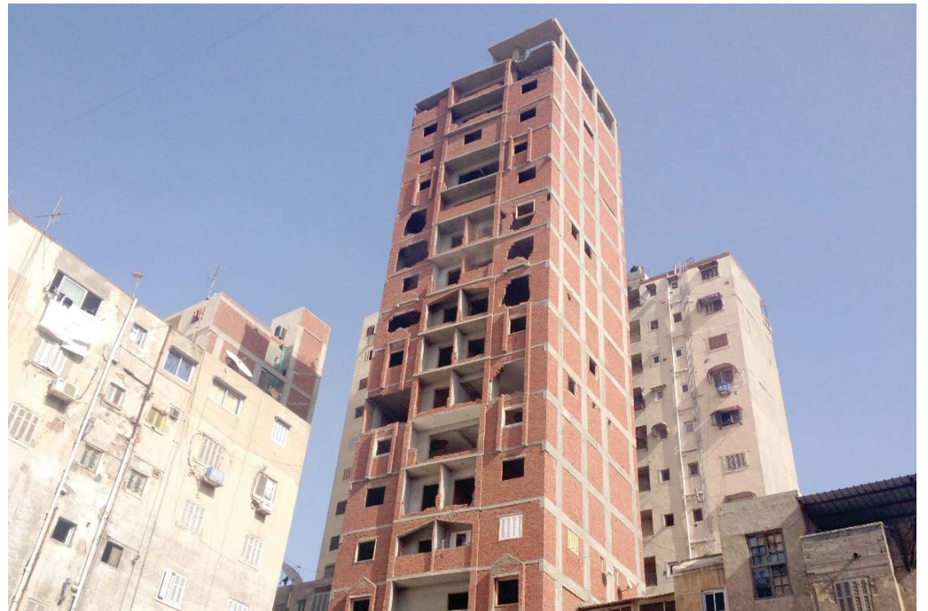
شواهد على فساد البلديات

مطاردة «مليارديرات الظل» في قطاع العقارات لحصر عمليات الاحتيال المتفاقمة على القانون