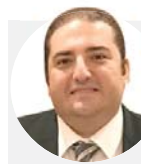
مدي بشاي قرار الحكومة ضربة للأعمال المرتبطة بقطاع التشبيد

ويملك رجال أعمال وسائل كثيرة للهروب من طائلة القانون عبر نظام محكم يطلق عليه الـ"كاحول"، وهي فكرة قائمة على الدفع بنسخ شخصي لجميع العقوبات الجنائية عن المشروع أو البرج السكني مقابل مبلغ يتم الاتفاق عليه من جانب "مليارديرات الظل"، وتشطت هذه الظاهرة على مدى عقود، وامتدت حاليا لجميع المحافظات.