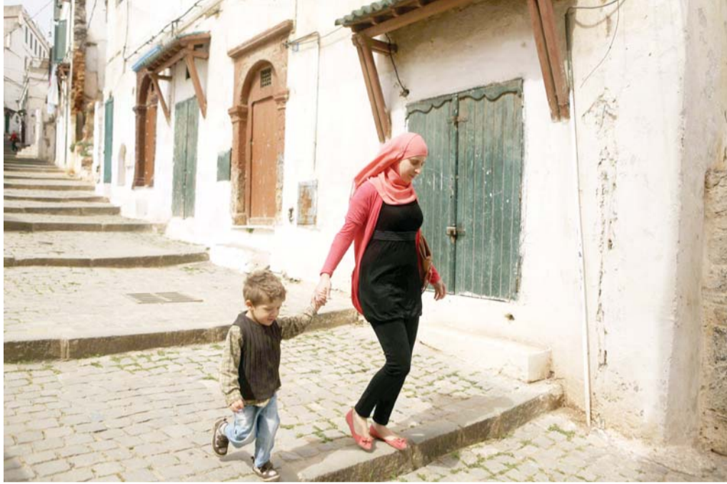
أجيال تتطور والتوازن الأسري هو الهدف