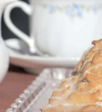
متنفس يكافح القلق

أشكال فريدة من الكعك، تستوحىها من تديونيات من التاريخ والأدب إلى جانب ضالتها الشخصي من أجل الحفاظ على صحتها العقلية، وتضخم إنتاجها من الكعك مؤخرًا بما يتناسب مع الضغوط التي تعانيها من جراء أزمة كورونا.