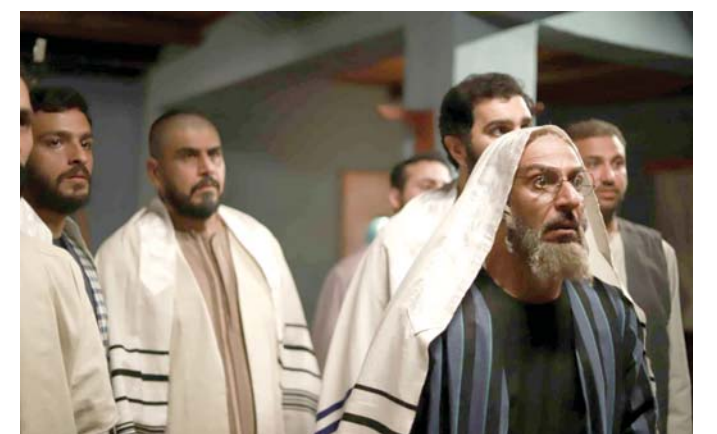
الاختلاف في الدين لا يمنع التعايش المشترك

وأشار العدل إلى أن كل عمل يتناول اليهود تتقاذفه الاتهامات بالتطبيع، ودعا الرافضين إلى مشاهدة العمل قبل توجيه اللوم، ولا بد من التفرة بين اليهود الذين عاشوا في المنطقة العربية وانتقلوا إلى إسرائيل عند