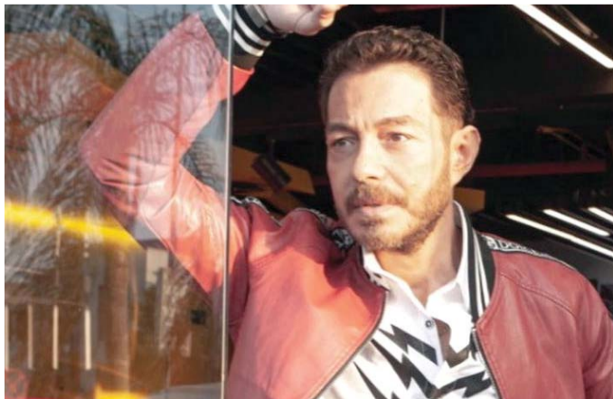
شخصية متعددة الأوجه

كشفت أحمد زاهر في حوار مع «العرب»، أن صعوبة شخصية فتحي تكمن في انفعالاتها الكثيرة والمتقلبة، المطلقة.