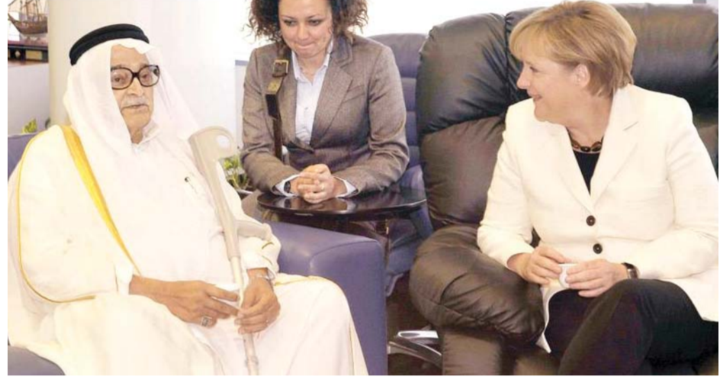
● تكفير المتطرفين للشيخ كامل يعود إلى تصريحات جريئة أدلى بها، أو إلى مشاريع يقوم بإنشائها تعتبر محرمة في عرفهم كاهتمامه المبكر بالمرأة، مثل المصنع الذي أنشاه في مكة قبل أربعين سنة وخصصه للنساء، وكان مصيره الإفقال.