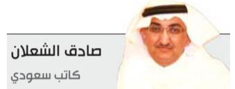
صادق الشعلان كاتب سعودي

كان الشغف يُسيّره مع التحدي والثقة في نفسه وقدراته، ويحدوه الأمل في صناعة اقتصاد سعودي متنوع وقوي وتوفير فرص عمل للشباب، كان