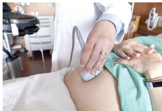
تناول الحبوب الكاملة يرفع احتمالات الحمل

وتدعم العديد من الدراسات هذه الحقائق مثل تلك التي نشرت في مجلة أكسفورد، عن التكاثر البشري. وفي هذه الدراسة تحديدا، قُيم الباحثون العادات الغذائية لـ 244 امرأة (22 - 41 سنة)، (مؤشر كتلة الجسم - 30 كجم / م2) واللواتي خضعن لعملية الإخصاب خارج الجسم في اليونان، حيث أظهرت الدراسة أن النساء اللواتي اتبعن حمية البحر المتوسط حصلن على معدلات حمل أعلى (بنسبة 50 في المئة) مقارنة بالنساء اللواتي لم يتبعن هذا النظام الغذائي (بنسبة 29.1 في المئة). وكان الفرق جليا أكثر في النساء دون سن الخامسة والثلاثين.