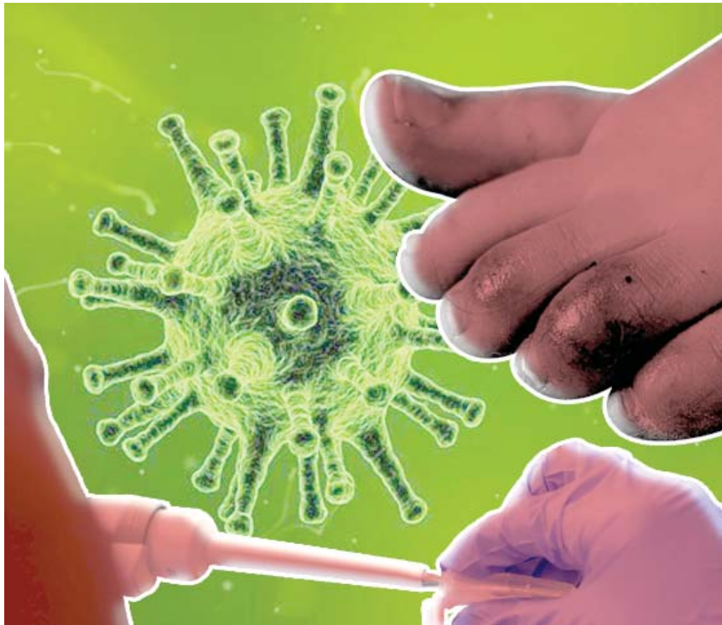
كورونا يطال غالبية أجزاء الجسم