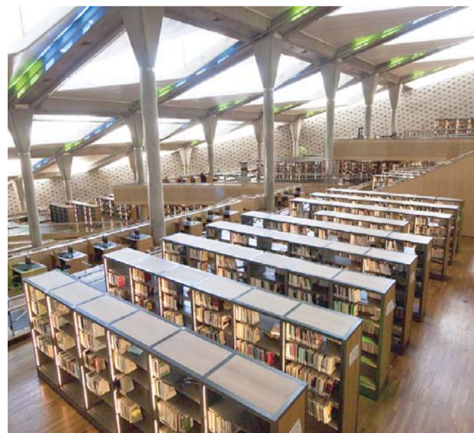
المكتبة مفتوحة افتراضيا

وأنظمة أخرى لتحليل البيانات الخاصة بالمرض والمريض، واستخدام النظم الروبوتية للحد من العدوى، والمساهمة