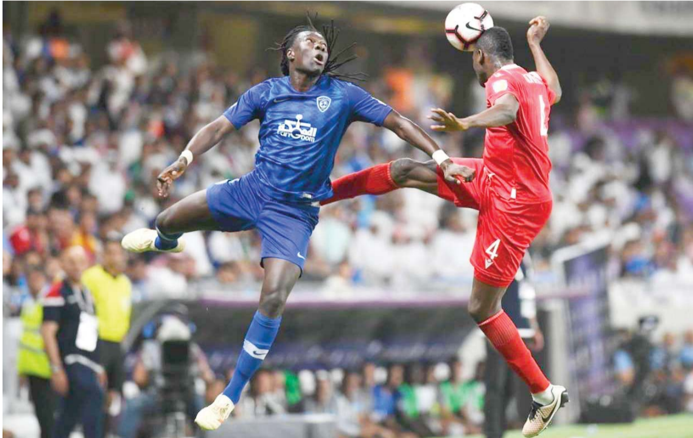
كوناتي رقم صعب في فريق النجم التونسي

الصفافسي يحتفظ بالرباعي الجزائري وعقد كوناتي يثقل كاهل النجم الساحلي