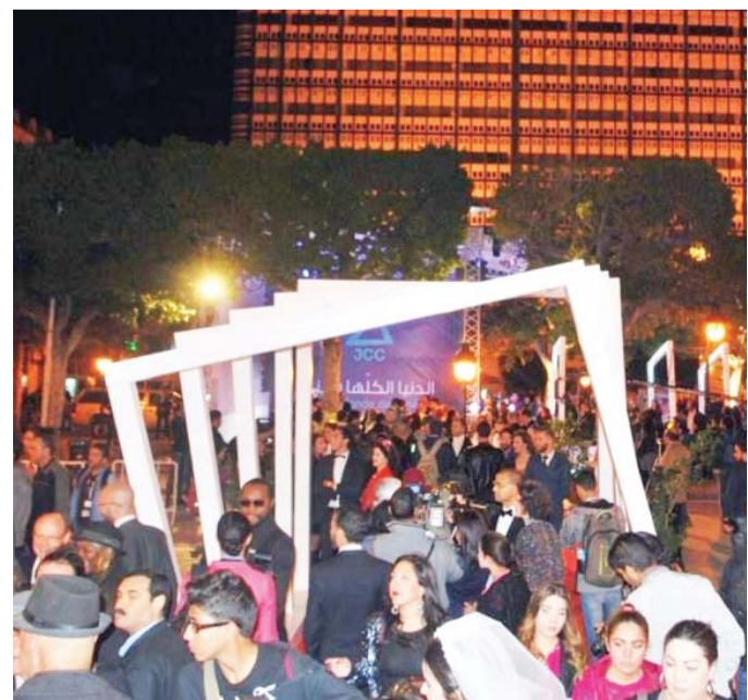
من الصعب أن يتدافع الجمهور على مشاهدة أفلام مهرجان قرطاج مُجددا

مع الخسائر المالية الفادحة التي ضربت استثماراتها في مصر وتوقّف السياحة وابتعاد السياح تحديدا عن زيارة المنجعات، وخاصة أن سميج ساويرس صاحب قرية الجونة السياحية كان قد أعلن ظهور حالة لمصاب بالفايروس في قريته السياحية وطالب بضرورة تخصيص مستشفى قريب، في مدينة الغردقة لاستقبال الحالات المُماثلة وعزلها؛ ومهرجانات مصر الأخرى، مثل أسوان لأفلام المرأة والأقصر للفيلم الأفريقي وشرم الشيخ الآسيوي والإسكندرية، وغيرها تخضع في قراراتها لما يُقرره المحافظون المسؤولون عن إدارة الأمور في المحافظات التي تقام فيها مثل هذه