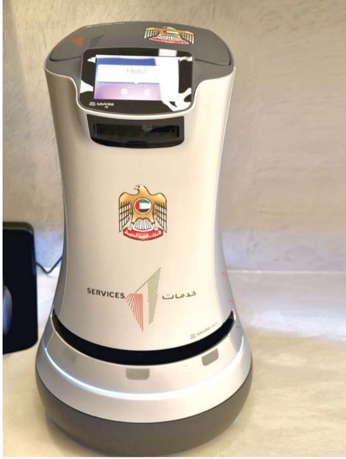
روبوت يزوج الإماراتيين

وكانت محكمة الأحوال الشخصية في دبي علقت قبل أيام خدمات عقود الزواج والطلاق، لكن قرار وزارة العدل بات يتيح الزواج من المنزل. ولم يصدر أي قرار بشأن إمكانية الطلاق عن بعد.