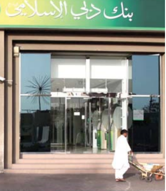
دور أكبر للصيرفة الإسلامية