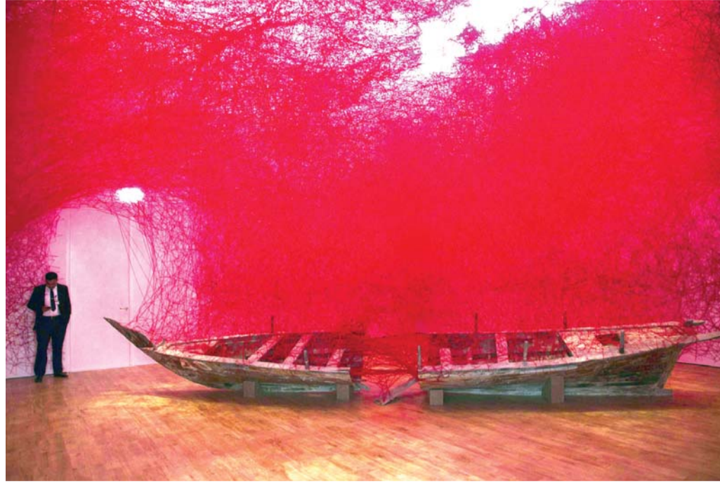
فوائد جمة في استعمال الإنترنت ووسائل التواصل الاجتماعي

ففي المغرب - على سبيل المثال - تفجرت في الأونة الأخيرة قضية جنائية بسبب ما يعرف إعلامياً بـ "حمزة مون بيبى" (Hamza Mon Bébé)، حيث تخصص حساب مزيف، تحت هذا الاسم، بسرقة وتشويه سمعة الفنانين المنافسين والانتقام من الأشخاص. وبسبب ظهور جريمة جديدة هي الجريمة الإلكترونية، وبفضل تطور علم الإجرام مواكبة لمستجدات العصر، تمكن القضاء من وضع اليد على من يقف خلف ذلك الحساب المزيف، الذي كان سبباً في أضرار نفسية واجتماعية بالغة الخطورة وصلت إلى حد الطلاق. وشخصياً كنت قد عبرت عن رأي في الفيسبوك، يتعلق بمشاركة ناقدتين مسرحيتين مغربيين في مهرجان القاهرة