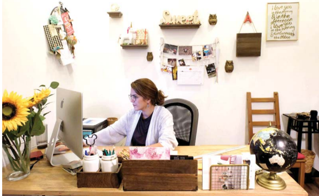
عدم اختلاط مهام العمل مع أعمال المنزل

وأوضح أخصائيو العلاقات الزوجية والأسرية أن الأمهات العاملات من المنزل