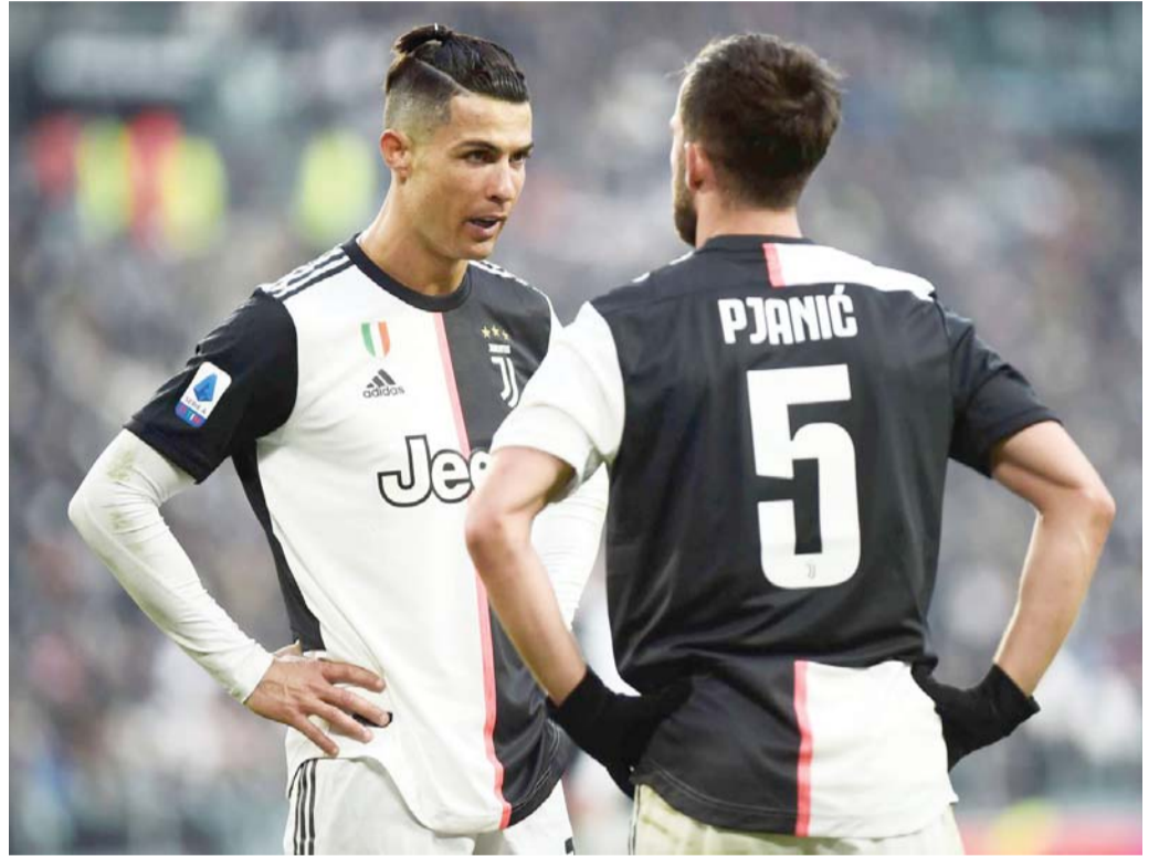
خيارات قيد الدرس

الدوري الإيطالي بوابة الفريق الإنجليزي لدعم صفوفه