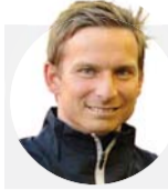
بيب ليندرز كلوب مدرب ذكي جدا ويحرك الأمور في الاتجاه الصائب

وأضاف "بالنسبة لي أهم شيء للاعب أن يحافظ على أفضل شكل له من خلال التغذية والتدريب والخطط التكتيكية".