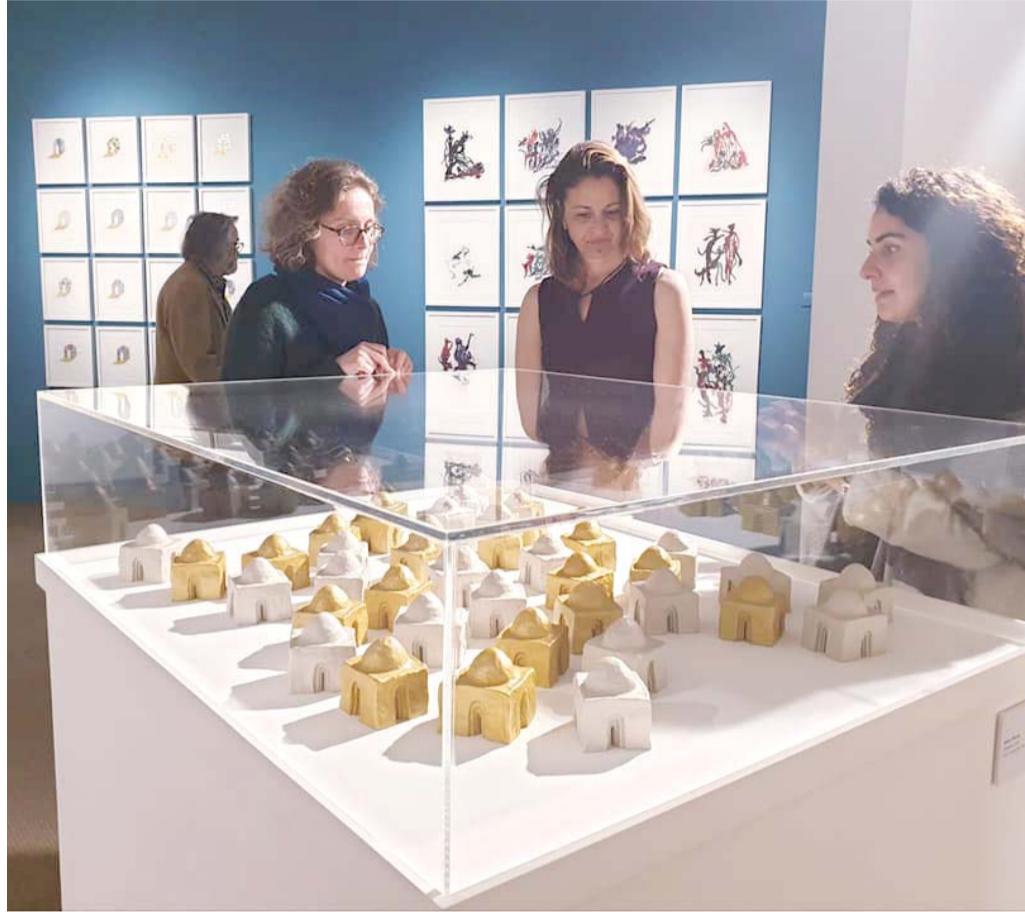
مقامات صوفية جديدة

متحف بول فاليري في سبت الفرنسية يحتضن أعمال بشار الحروب