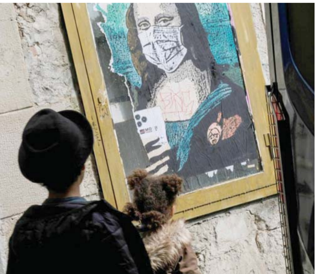
يستلهمون الموناليزا.. حتى في كورونا

لا تعلم حتى الآن الثمن الذي ستدفعه البشرية، بسبب جانحة كورونا، سواء على الصعيد البشري، أو الاقتصادي، أو الاجتماعي، ولكن ما نعرفه، بالتأكيد، أن صورة موناليزا، مرديدة قناعاً طبياً على وجهها، ستبقى بعد رحيل آخر من شهد الوباء من البشر، لتكون هي شاهد على عام 2020، العام الذي اجتاح فيه فيروس كورونا دول العالم.