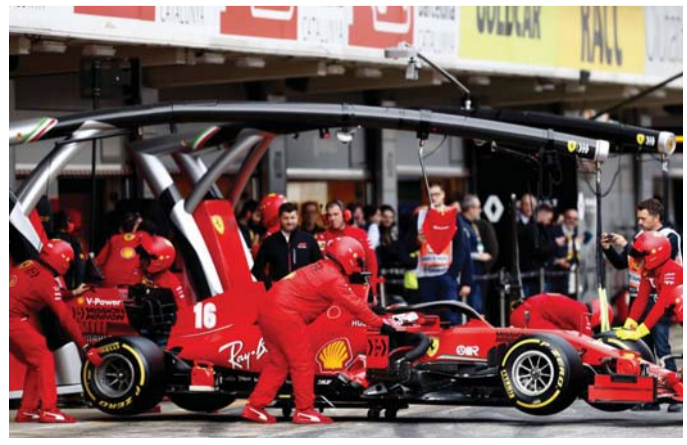
القوة في العمل الجماعي

وقال زافانور عن ذلك "دائمًا قبلنا التعديلات لأننا سنستخدم صندوق السرعة الخاصة بهم (مرسيدس) وقواعدهم الخاصة بمؤخرة السيارة". واکمل "أردنا دوما التخلص من التصميم القديم ونجحنًا أخيرًا الآن بعد توفر الكثير من الموارد أماننا للقيام بذلك".