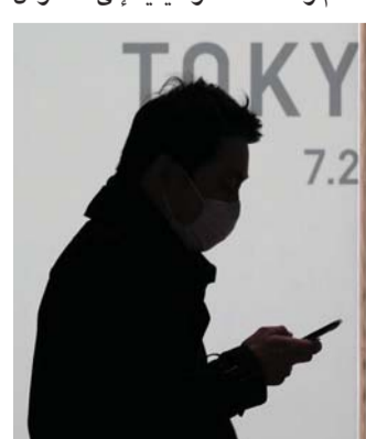
بانتظار الخبر اليقين

وعزز رئيس الوزراء الياباني شينزو آبي الإجراءات الوطنية لاحتواء الفيروس، داعياً منظمي الأحداث الكبرى إلى التفكير في إلغائها أو إرجائها. وقد تأثر كل شيء من مباريات كرة القدم والحفلات الموسيقية إلى الطقوس