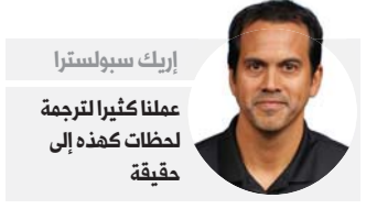
إريك سبولسترا عملنا كثيراً الترجمة لحظات كهذه إلى حقيقة

أما مدربه إريك سبولسترا، فرأى أن فريقه قدم أخيراً لعباً دفاعياً كان يؤمن بقدرة على تحقيقه "عملنا كثيراً على ترجمة لحظات كهذه. لكن لا أقول إننا قادرون بانتظام على كبح جماح فرق كبيرة هجومية تحت تسعين حاجز نقطة".