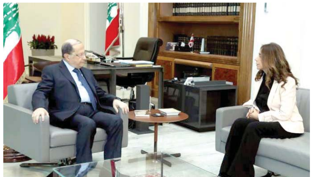
● اسم عكر نقطة خلافية كبيرة وسبب أساسي من أسباب انقسام الشارع حول الحكومة، في ظل عدم وجود أي تاريخ سياسي لها، ما أثار الشكوك حول الهدف من تعيينها.

قانون الدفاع الوطني في لبنان ينص على أنه ليست لوزير الدفاع سلطة مباشرة على الجيش اللبناني الموضوع بتصريف رئيس الجمهورية، فيما تقع سلطة الوزير على المؤسسات التابعة للوزارة، وهو عضو في المجلس الأعلى للدفاع، ويقترح اسماً لتولي قيادة الجيش، الذي يعين بررسوم يصدر عن الحكومة