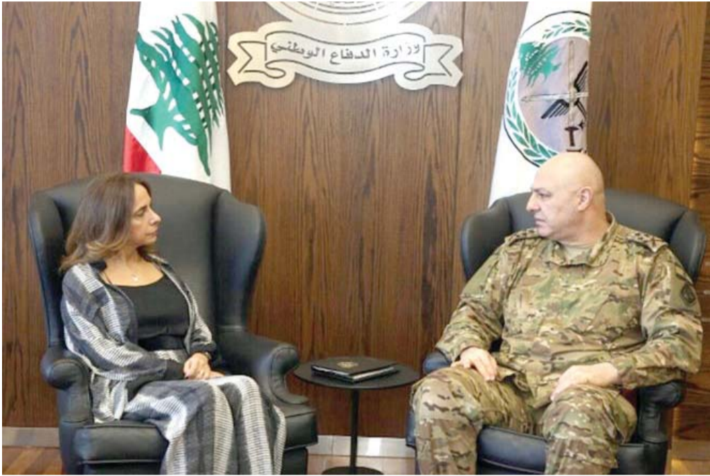
● وزيرة الدفاع اللبنانية الجديدة وعلى النقيض من سلفها إلياس بوصعب الذي قامت بينه وبين قائد الجيش الجنرال جوزيف عون علاقة معقدة، من المتوقع أن تعزز فكرة إطلاق يد الأخير في إدارة الجيش.