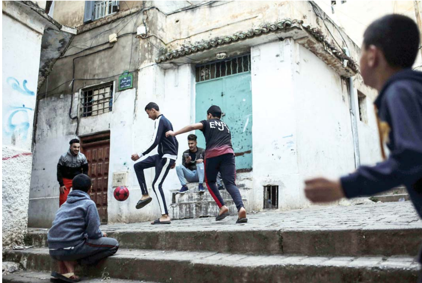
الأخبار الكاذبة توجه الرأي العام