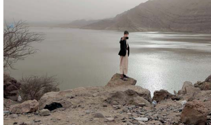
إنترنت من ثقب إبرة