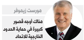
هورست زيهوفر هناك أوجه قصور كبيرة في حماية الحدود الخارجية للاتحاد

ورفض وزير الداخلية الألماني في وقت سابق مقترحات الحكومة الشعبية في إيطاليا بإدخال تغييرات على نظام دبلن، لكن يبدو أن تزكية إيطاليا للألمانية أورزولا فون دير لاين لمنصب رئيسة المفوضية كانت مقترنة بموافقتها على المقترحات الإيطالية بشأن الهجرة.