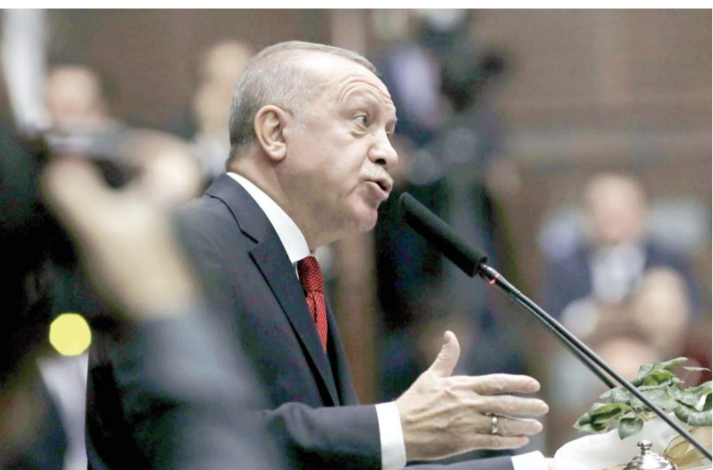
أنشأنا الأتراك والتركمان في كل مكان

أنقرة وحلفاؤها الإسلاميون يخططون لانتزاع مكاسب عجزوا عن فرضها عسكريا