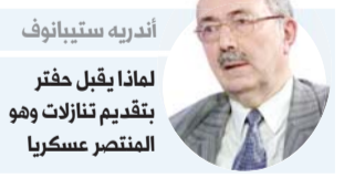
أندريه ستيفيانوف لماذا يقبل حفتر بتقديم تنازلات وهو المنتصر عسكريا

طرابلس - أحبط رفض القائد العام للجيش الليبي المشير خليفة حفتر التوقيع على مسودة اتفاق وقف إطلاق النار الذي ضغطت كل من موسكو وأنقرة لفرضه، مخطط الرئيس التركي رجب طيب أردوغان لتثبيت التدخل التركي في ليبيا. وغادر خليفة حفتر موسكو دون التوقيع على اتفاق لوقف إطلاق النار وافق عليه الإسلاميون الذين يمثلهم رئيس حكومة الوفاق فايز السراج. ولم يلتق السراج وحفتر اللذان تتواجه القوات الموالية لهما منذ تسعة أشهر على أبواب طرابلس، خلال محادثات موسكو الإثنين. لكنهما تفاوضا على اتفاق لوقف إطلاق النار عبر وزراء الخارجية والدفاع الروسيين والتركيين. وجرت هذه المفاوضات، التي تعكس التأثير المتزايد لموسكو في هذا الملف الشائك، نتيجة اتفاق روسي تركي أعلنه في إسطنبول الرئيسان التركي والروسي في الثامن من يناير. وتشير التسريبات إلى أن حفتر اشترط إضافة بنود تنص على إخراج القوات التركية، إضافة إلى نزاع سلاح الميليشيات. ولعب أردوغان دورا كبيرا في إقناع روسيا بضرورة وقف إطلاق النار حيث أرسل وفدا إلى موسكو نهاية ديسمبر الماضي. كما قام بسلسلة من المحادثات حيث زار تونس وأرسل وزير خارجيته مولود جاويش وأوغلو إلى الجزائر في إطار الاستعداد للمعركة السياسية ضد الجيش الليبي وحلفائه. ويهدف أردوغان إلى استغلال عضوية تونس داخل مجلس الأمن لإدانة الجيش، أما الجزائر فيعمل عليها للوقوف مع الإسلاميين في مؤتمر برلين الذي ستشارك فيه. وإلى زيادة دعمه العسكري لمليشيات حكومة الوفاق، على أنه مجرد تهديد للجيش الهدف