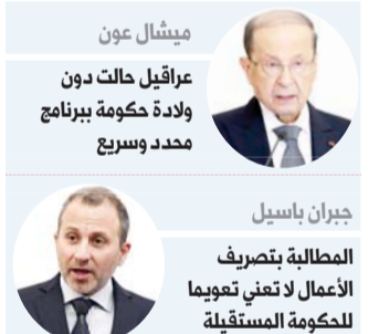
ميشال عون عراقيل حالت دون ولادة حكومة ببرنامح محدد وسريع

وشكل موقف رئيس التيار الوطني الحر وزير الخارجية جبران باسيل بعدم المشاركة في حكومة دياب العتيدة، إضافة جديدة تنضم في ذلك إلى موقف زعيم حركة أمل رئيس مجلس النواب نبيه بري الذي أعلن قبل أيام أن تياره لن يشارك في هذه الحكومة وسيمنحها الثقة إذا تم تشكيلها. ولا يمكن عمليا لدياب أن يستمر في مهمته طالما سحب القوى السياسية التي أتت به رعايتها له، كما أن رئيس الجمهورية ميشال عون لم يعد يخفي استياءه من أداء دياب، حتى أن استقباله للنائب فؤاد الخنزومي اعتبر إشارة لدياب كما لبقية أطراف الطبقة السياسية إلى أن البديل بات جاهزا. وقال باسيل في مؤتمر صحفي الثلاثاء إن المطالبة بتصريف الأعمال لا تعني تعويلا للحكومة المستقلة ولا تؤخر تشكيل حكومة جديدة. ولا يسمح الدستور اللبناني بسحب التكليف من الرئيس المكلف وهو ما يطرح أسئلة حول الكيفية التي يمكن من خلالها "التخلص" من شخصية لا تحظى بأي غطاء سياسي وطاقني وشعبي. وتقوم القوى السياسية، لاسيما باسيل وعون، بالضغط مباشرة على دياب، فيما يعتبر موقف بري المطالب بحكومة تكنوقراطية نوعا من الضغوط غير المباشرة على دياب الذي ما زال مصرا على تشكيل حكومة اختصاصيين مستقلين عن التيارات السياسية.