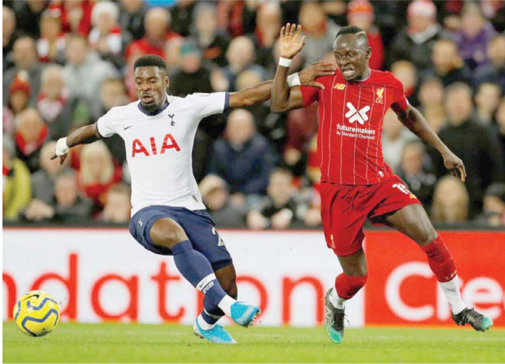
ملحمة بروح أخرى

ليستر سيتي يواجه ساوثهامبتون وعينه على تعثر المتصدر