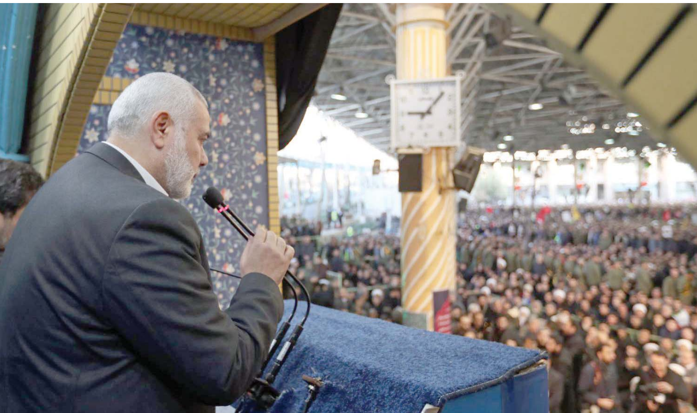
هنية خلال مراسم تشييع سليمان في طهران

الحركة تتعاطف مع طهران في مقتل سليمان في دون التورط مع الجانب الأميركي