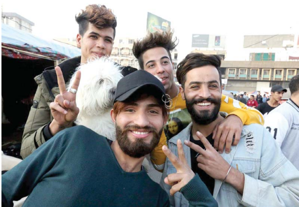
نُفعل ما نريد هنا

تسعينات القرن الماضي، في صالونات ومحال حلاقة للرجال في الأحياء الشعبية لمدينة الصدر" في شمال شرق بغداد. ويعتبر المصور زهير العطواني الذي يتحدر من مدينة الصدر والمشهور في العراق، من أكثر المروجين لموديلات الشعر المتكررة من خلال حفلات الزواج التي يصورها ويشارك فيها شباب بتسريحات شعر مختلفة.