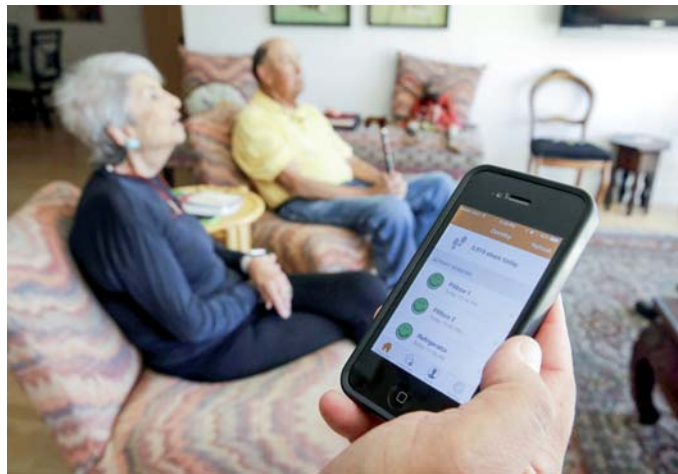
إدارة البيانات والمواعيد المهمة