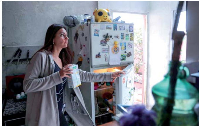
القصاصات الورقية صارت من الماضي

«جوبلين» فإنه يربط الملاحظات بقوائم المهام، ولذلك فإنه يتعين على المستخدم تجريب عدة تطبيقات في البداية، حتى يتعرف على الوظائف المهمة بالنسبة له، مثل وظيفة البحث داخل الملاحظات أو وظيفة تصنيف التعليقات.