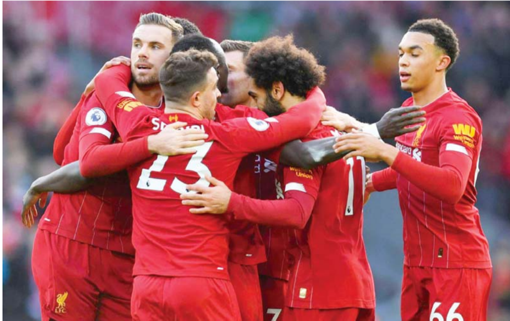
البحث عن المجد العالمي