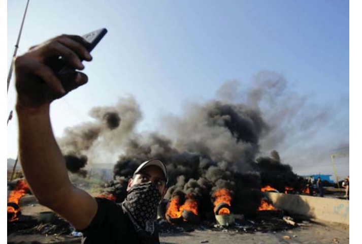
لعل ناشط رؤيته السياسية

بيروت - وجد باحثون في منظمة الحقوق الرقمية الكندية "ستيزين لاب" أن الاحتجاجات الأخيرة في العراق ولبنان كانت مصحوبة بحملات تضليلية شرسة على موقع تويتر والتي لعب فيها المؤثرون، دورا رئيسيا. وفحص الباحثون التفاعلات على تويتر ووجدوا أن العلامات الرئيسية التي استخدمها المتظاهرون لتبادل المعلومات حول الاحتجاجات كانت أيضا أهدافا رئيسية للتلاعب. وقال اليكسي ابراهيمز، باحث في "ستيزين لاب"، "يبدو أن كل مجموعة تحاول التلاعب