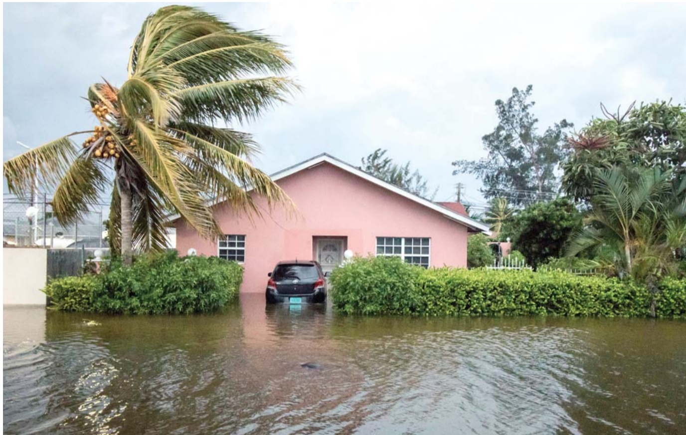
الفيضانات والعواصف أصبحت أحداثًا متكررة

الأعاصير المدمرة وحرائق الغابات تمتد من مشرق الأرض إلى مغربها