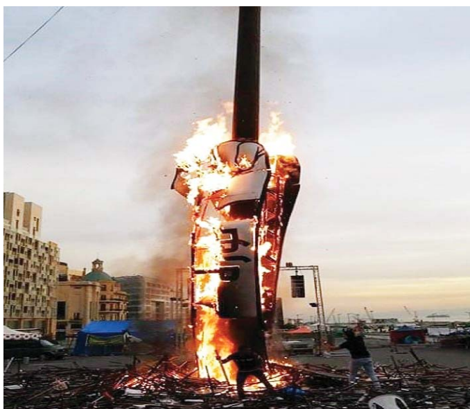
في إحراق المجسم إشعال جديد للثورة اللبنانية